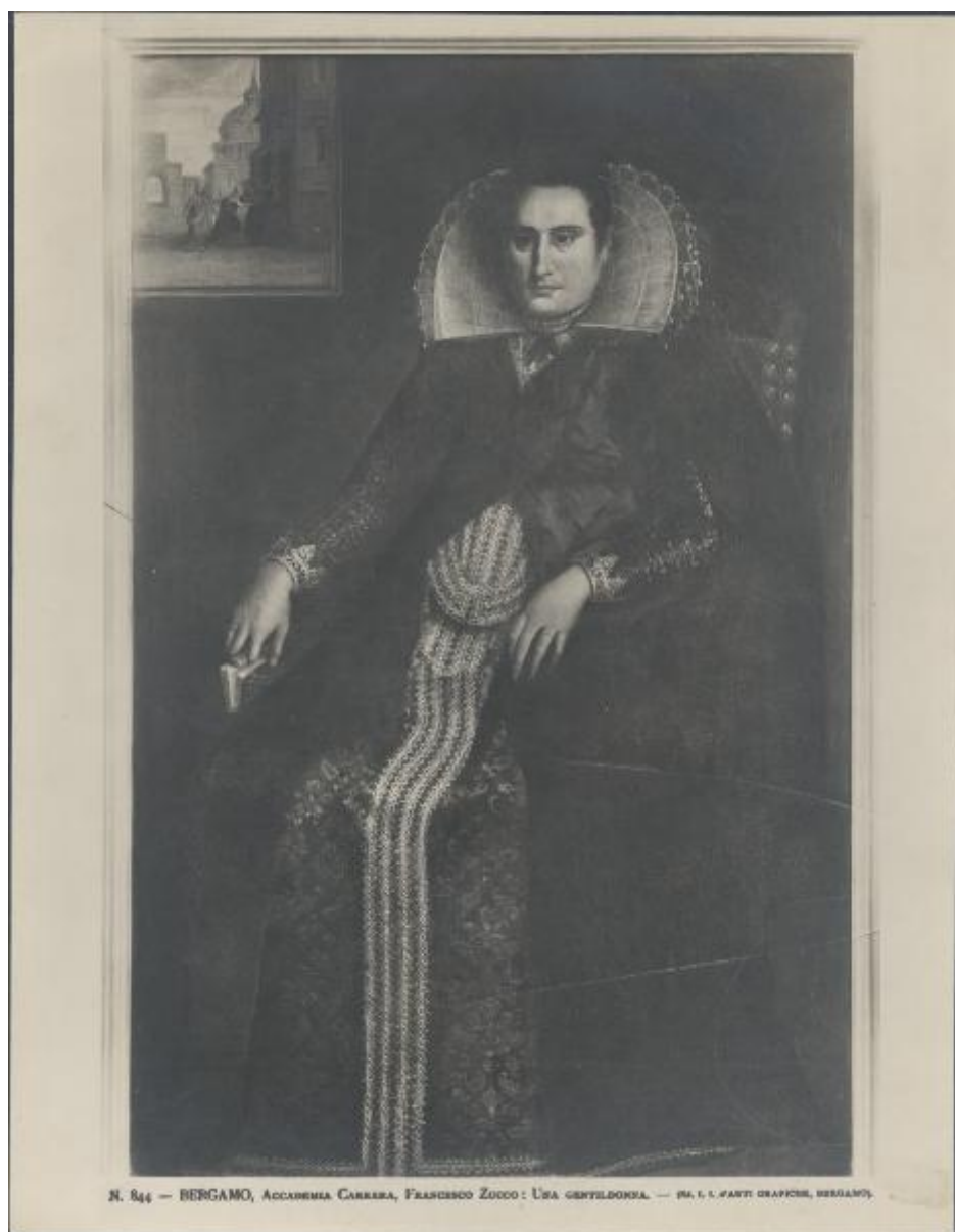
N. 844 — BERGAMO, ACCADEMIA CARRERA, FRANCESCO ZUCCO: UNA GENTILDONNA. — PA. L. I. FANTI GRAFICHE, BERGAMO.