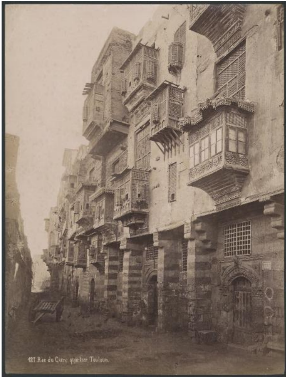
121. Rue du Caire quartier Toulouse.