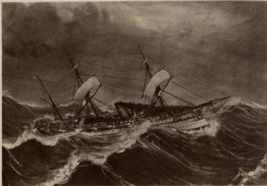
H.M. INDIAN TROOPSHIP "MALABAR"

In a Gale crossing the Bay of Biscay with the 4th Battalion of the Rifle Brigade and time expired men on board, Saturday, January, 26th, 1850.