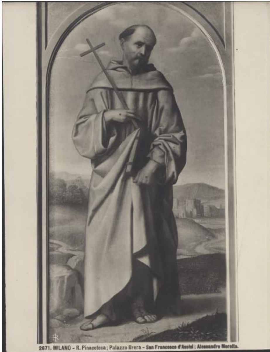
2671. MILANO - R. Pinacoteca; Palazzo Brera - San Francesco d'Assisi; Alessandro Morotto.