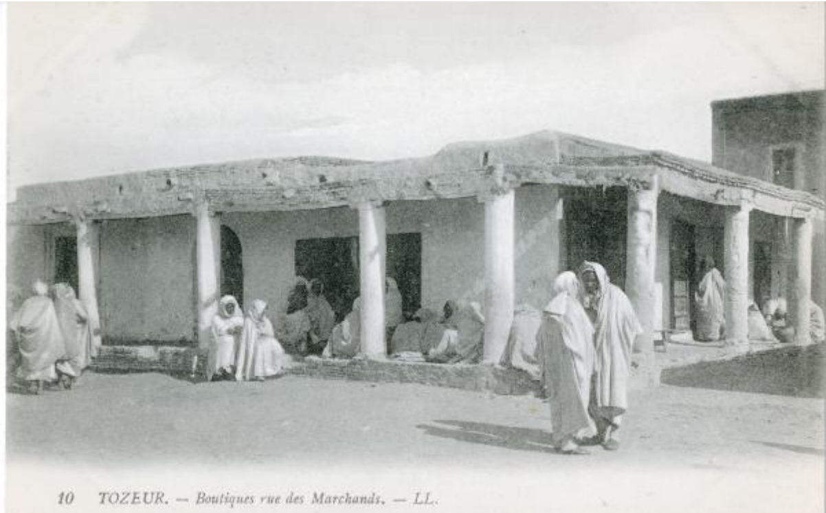
10 TOZEUR. — Boutiques rue des Marchands. — LL.