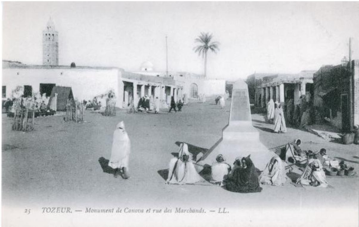
25 TOZEUR. — Monument de Canova et rue des Marchands.