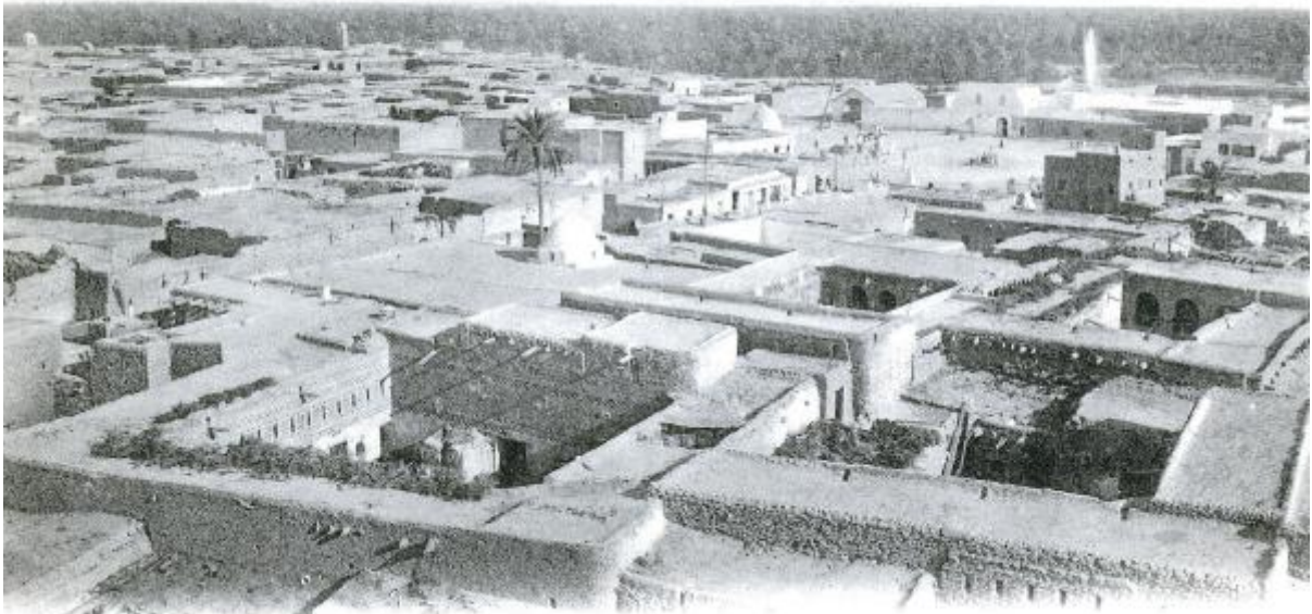
20 TOZEUR. — Panorama. — LL.