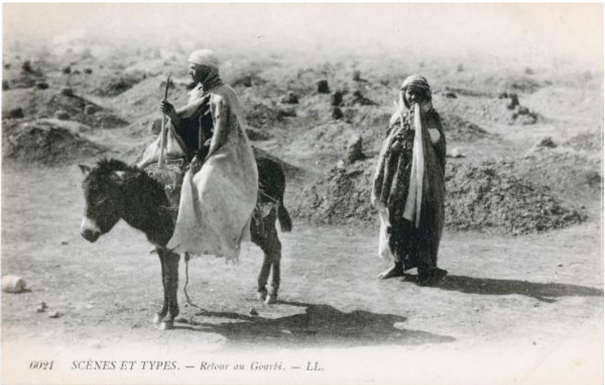
0021 SCÈNES ET TYPES. — Retour au Gourbi. — LL.