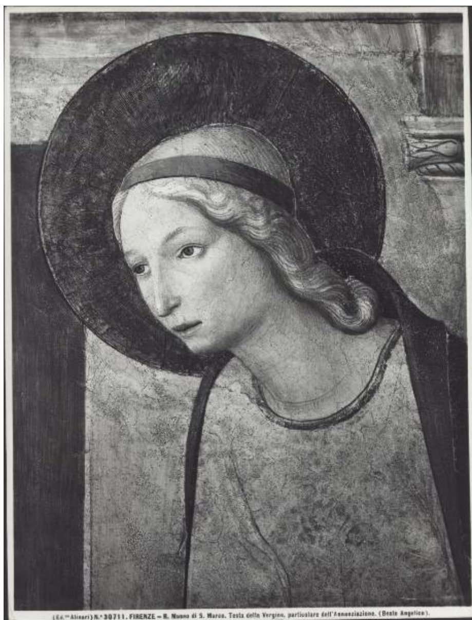
(64. th Alinari) N.° 30711. FIRENZE - R. Museo di S. Marco. Testa della Vergine, particolare dell'Annunziazione. (Beato Angelico).