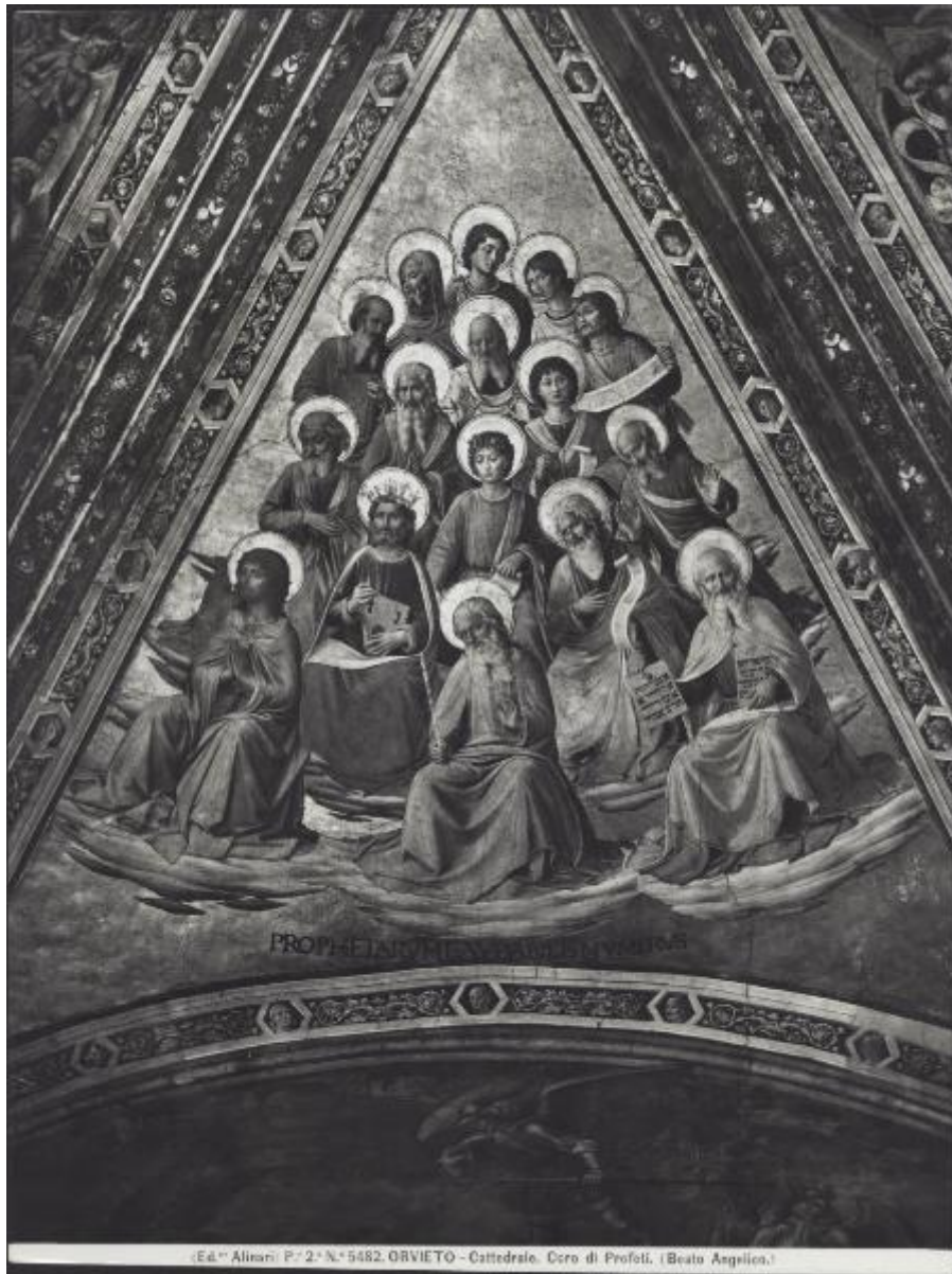
Ed. Alinari. P. 2. N. 5482. ORVIETO - Cattedrale. Coro di Profeti. (Beato Angelico.)