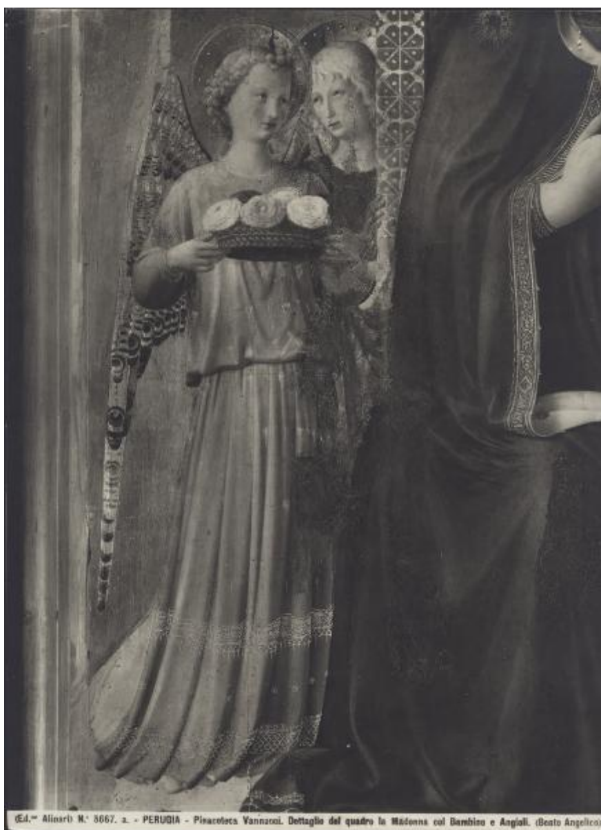
N.° 3667. a. - PERUGIA - Pisacoteca Vannozzi. Dettaglio del quadro la Madonna col Bambino e Angeli. (Beato Angelico).