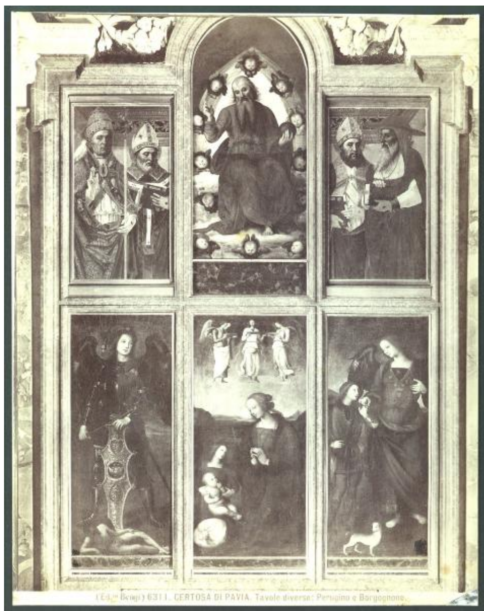
(Ed. Bruni) 6311. CERTOSA DI PAVIA. Tavole diverse: Perugino e Borgognone.