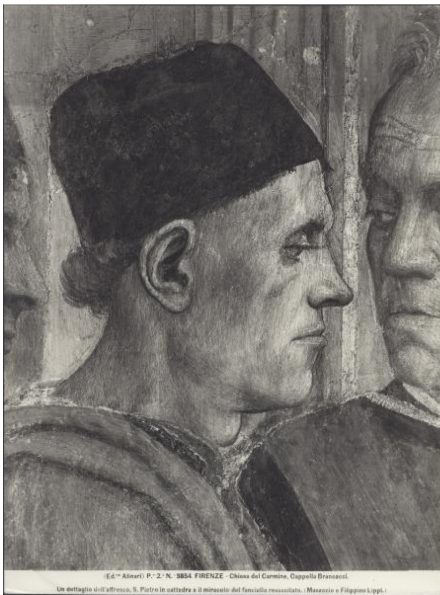
P. 2.° N. 3854 FIRENZE - Chiesa del Carmine, Cappella Brancacci.