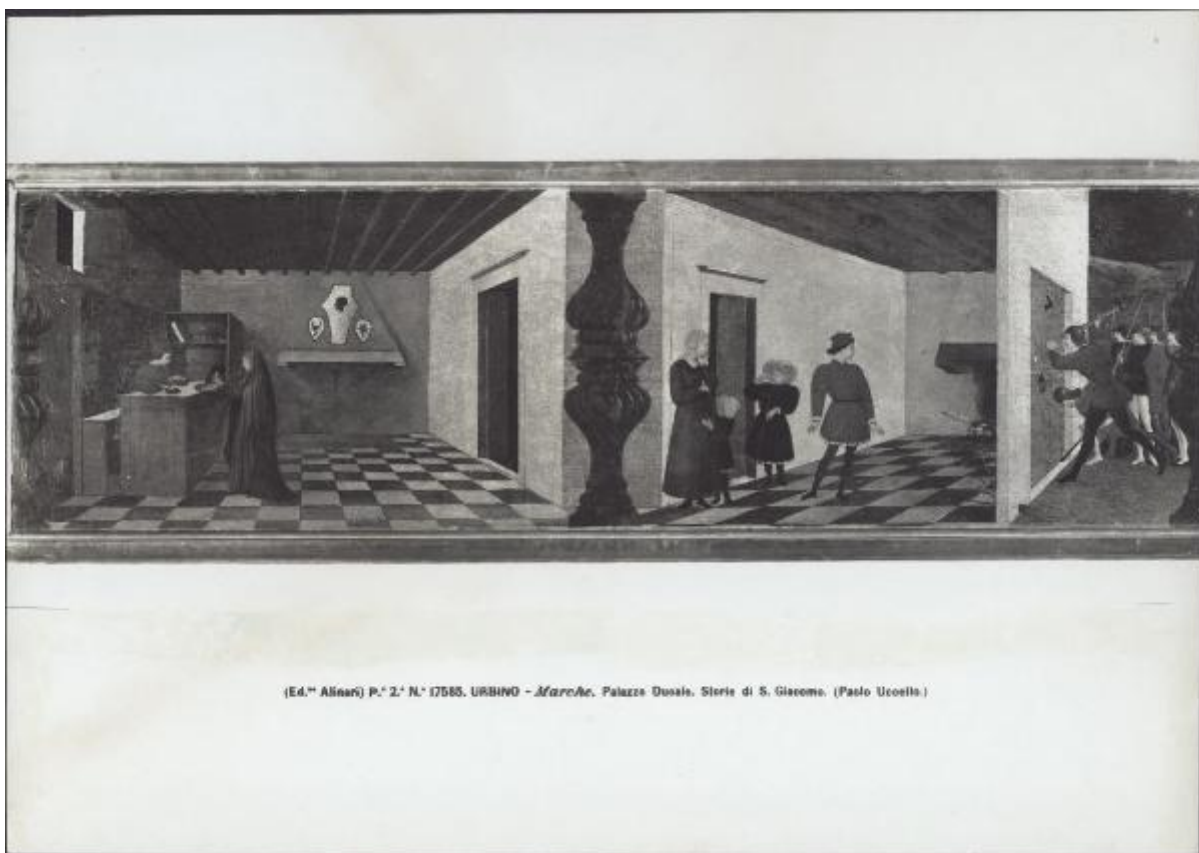
P. 2.° N.° 17585. URBINO - Marc'An. Palazzo Ducale. Storie di S. Giacomo. (Pislo Uccello.)