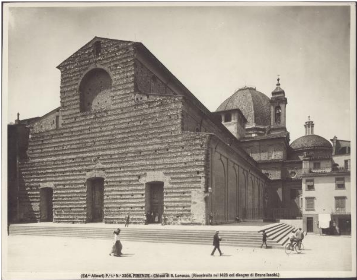
P. I. N. 2206, FIRENZE - Chiesa di S. Lorenzo. (Ricostruita nel 1429 col disegno di Brunelleschi.)