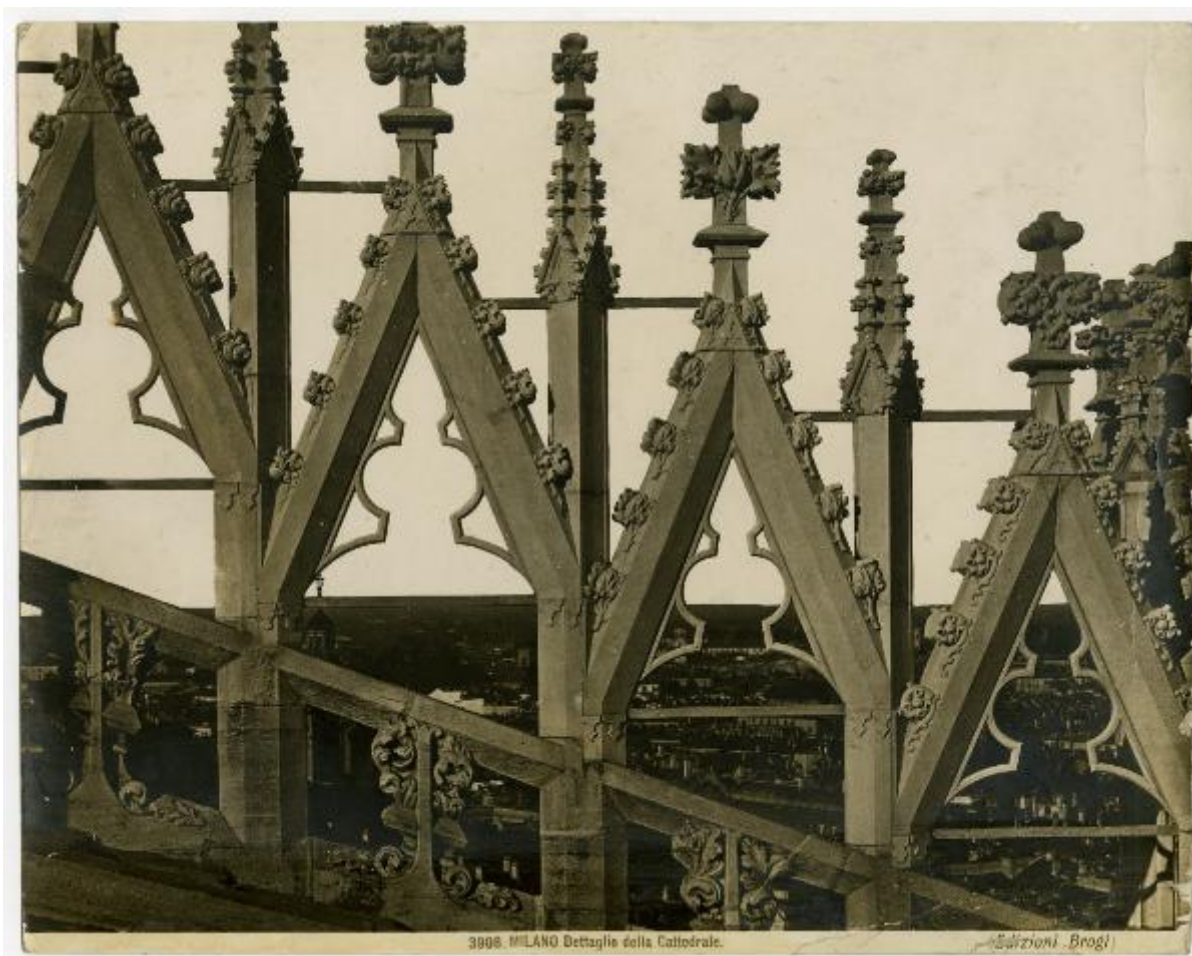
3908. MILANO Dettaglio della Cattedrale.