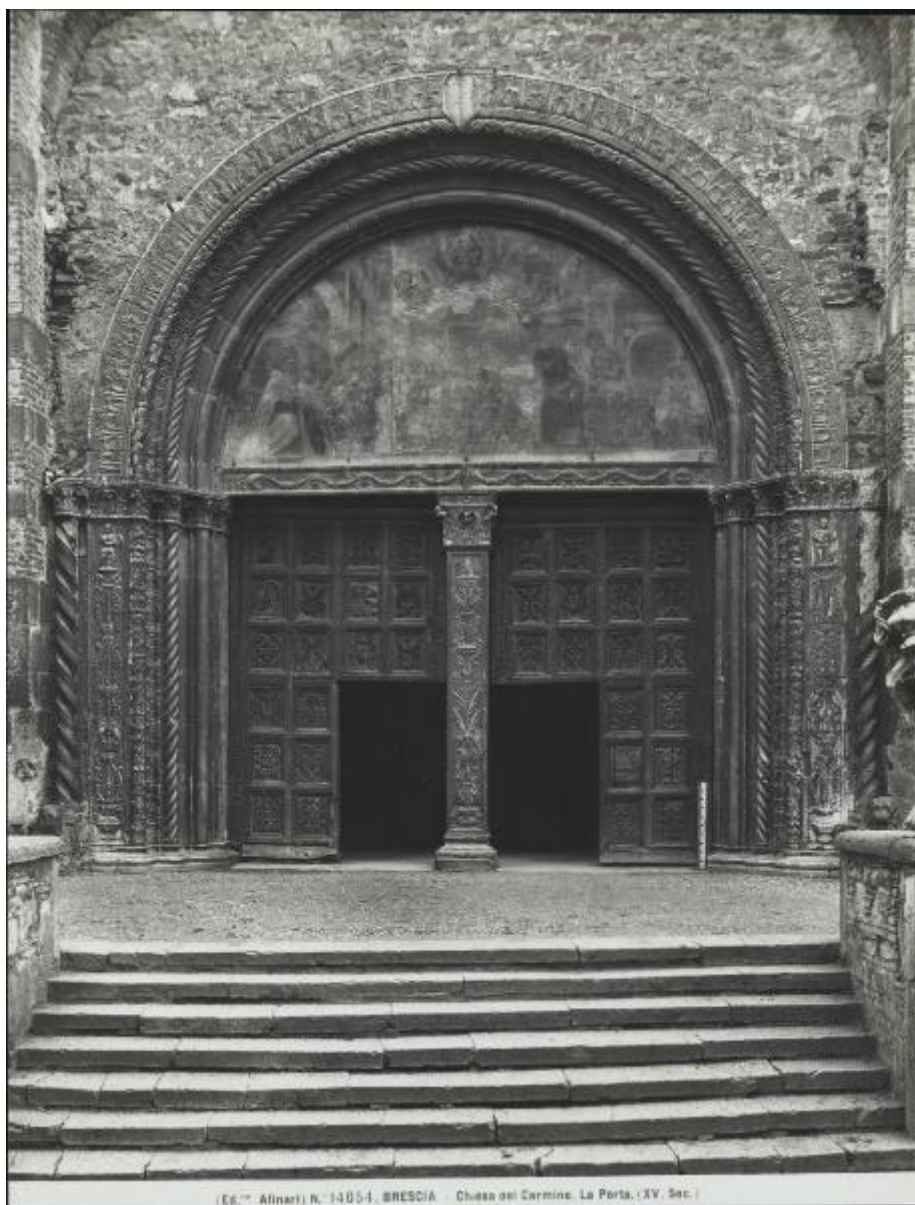
N.° 1405-1, BRESCIA - Chiesa del Carmine. La Porta. (XV. Sec.)