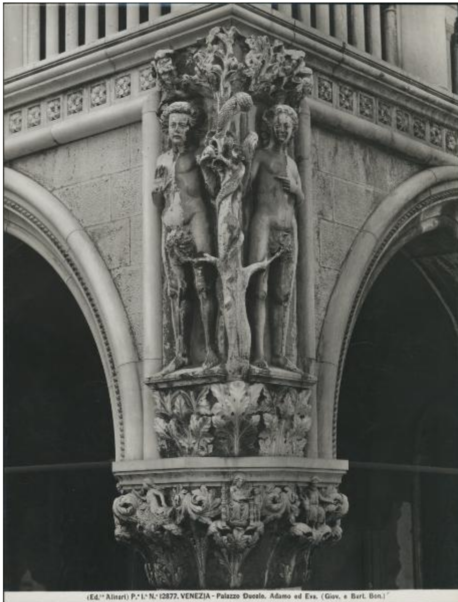
(Ed. Fratelli Alinari) P. I. N. 12877. VENEZIA - Palazzo Ducale. Adamo ed Eva. (Giov. e Bart. Bon.)

Link risorsa: https://www.lombardiabeniculturali.it/fotografie/schede/IMM-3a110-0000296/