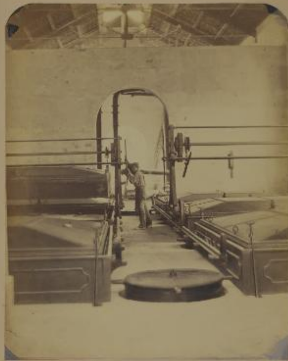
OFFICINA DEL ENZ DI MILANO-DEFOBATOBI COSTRUTTI NEL 1869

Inchiesta del Capo Museo FOTOGRAFICO 1880 - Espedite in via del LANCIO 1878