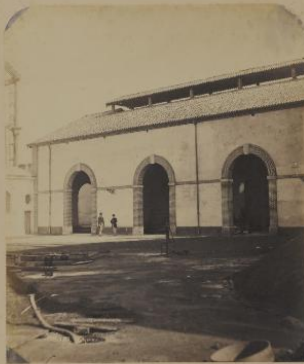
OPPICINA DEL CAZ DI MILANO-SALA DEI RIPARAZIONI VEDUTA ESTERNA COSTRITTA NEL 1866