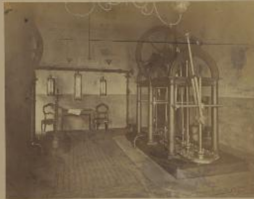
OFFICINA DEL GAZ DI MILANO - SALA DEGLI ESTRATTORI VEDUTA INTERNA COSTRUTTA NEL 1866