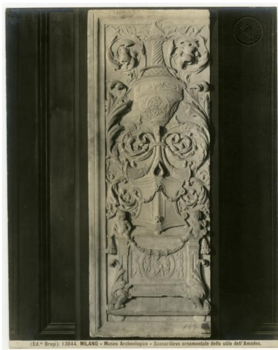
(Ed. Brogi) 13044. MILANO - Museo Archeologico - Bassorilievo ornamentale dello stile dell'Amadeo.