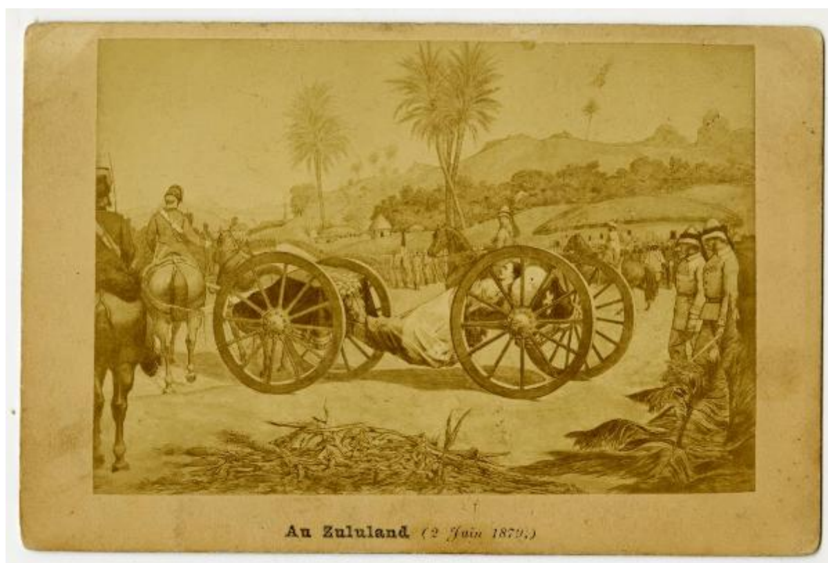
An Zululand (2 Juin 1879.)