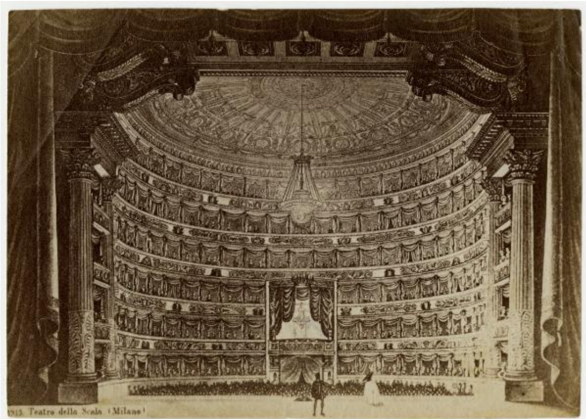
1815. Teatro della Scala (Milano)