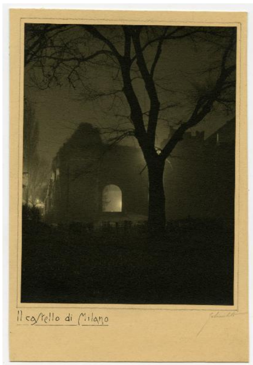
Il castello di Milano