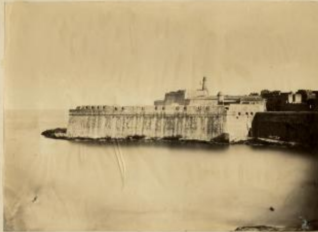
St. Elmo? Napoli