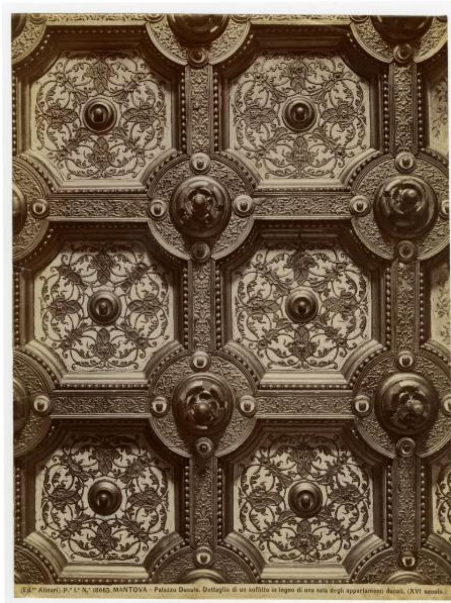
P. 1. N. 18865. MANTOVA - Palazzo Ducale. Dettaglio di un soffitto in legno di una sala degli appartamenti ducali. (XVI secolo.)