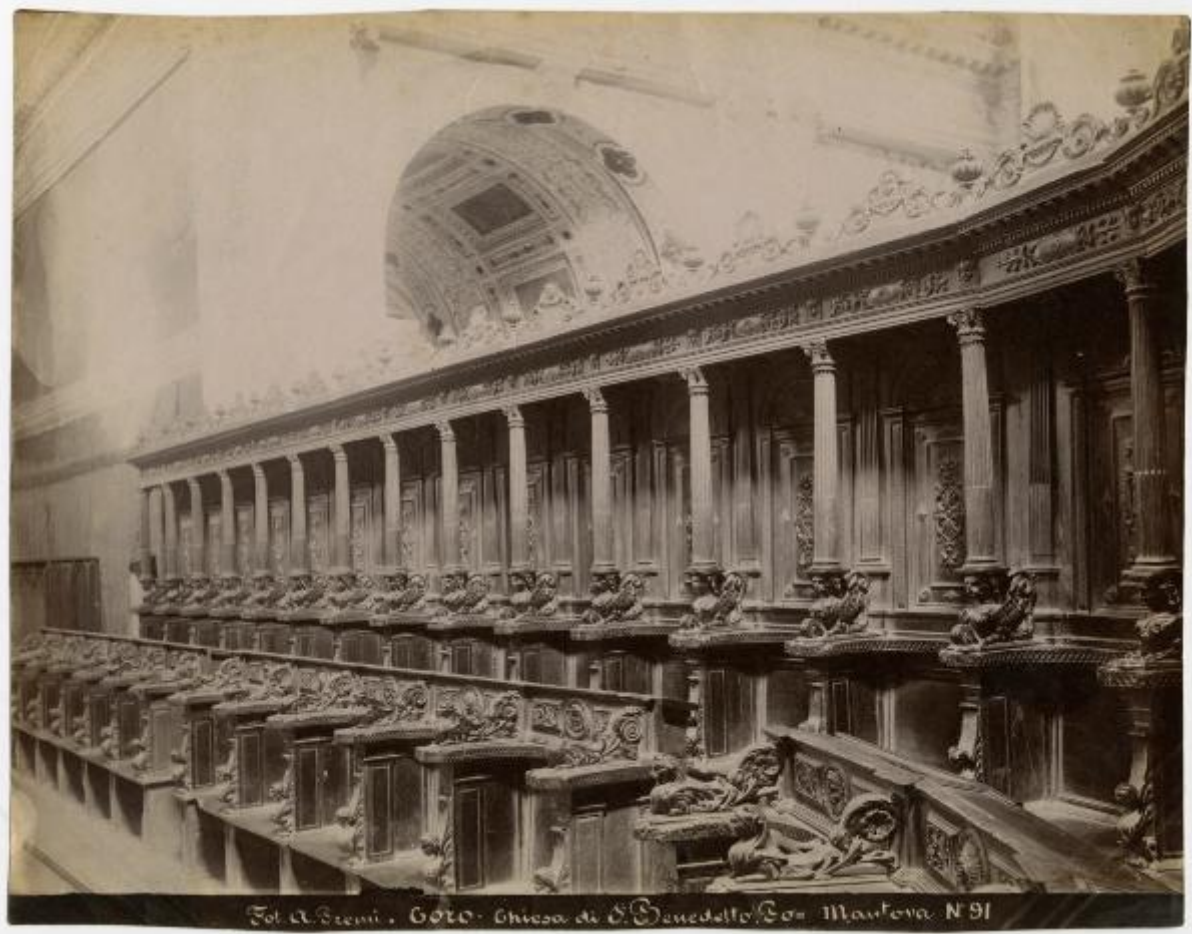
G. O. Chiesa di S. Benedetto. Co. Mantova. N. 91