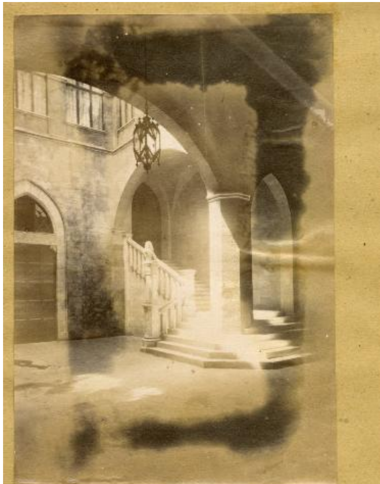
Atrio del Palazzo del Capitano di Giustizia (ora palazzo Grottonelli.)