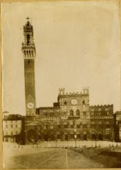
Palazzo del Comune