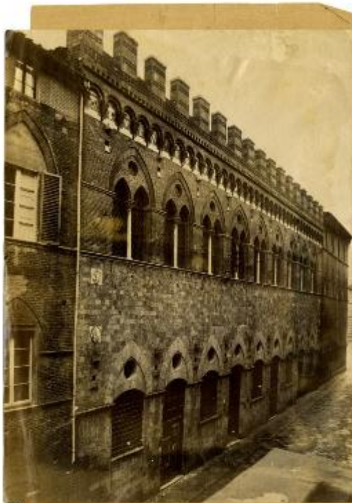
Palazzo Grottonelli -