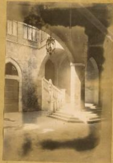
Int. del Palazzo del Capitano di Giustizia (ora palazzo Grottonelli)