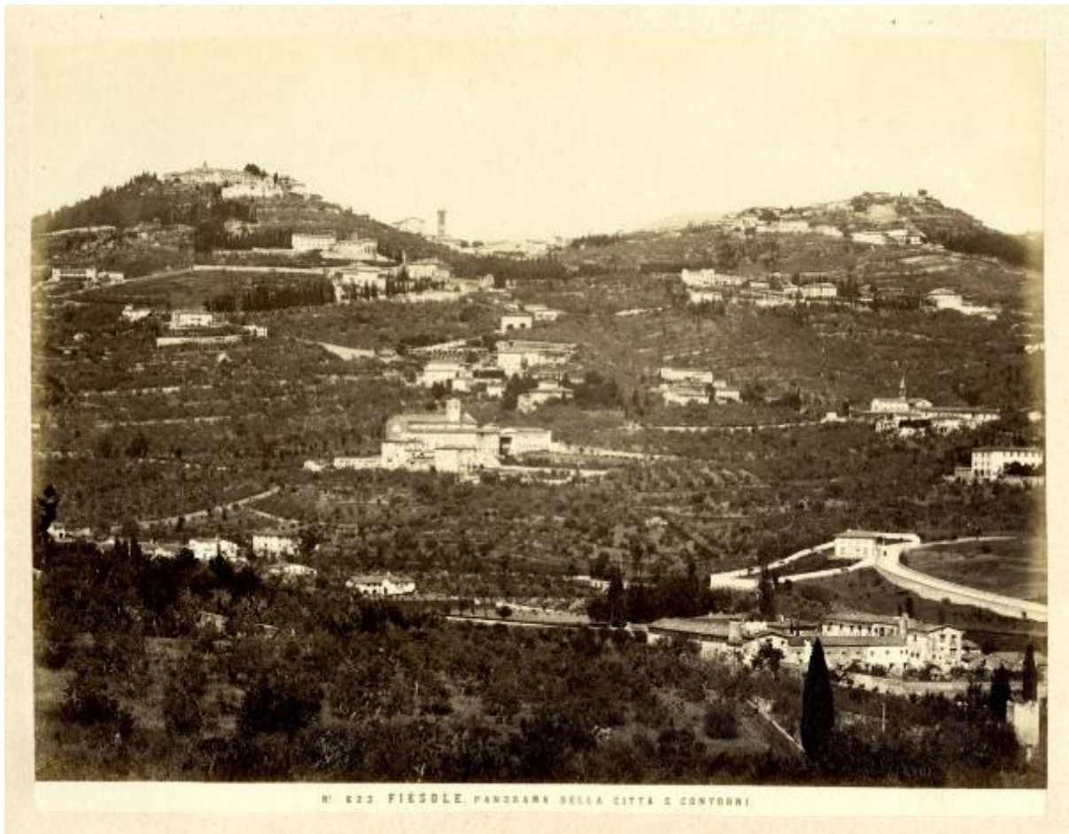
N. 623 FIESOLE. PANORAMA DELLA CITTÀ E CONTORNI.