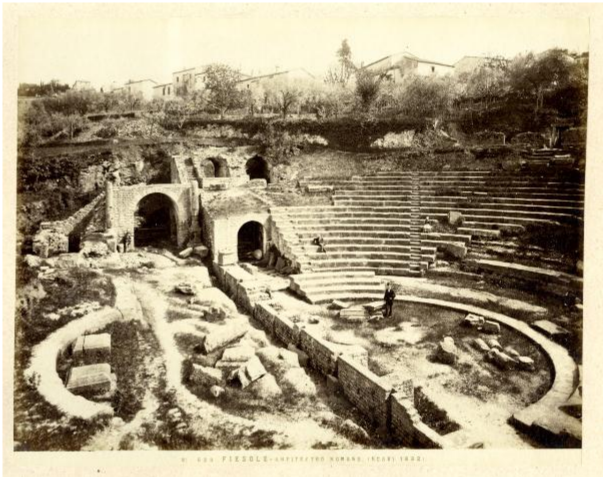
PIESOLE - AMPITHEATRO ROMANO (1897) 1897