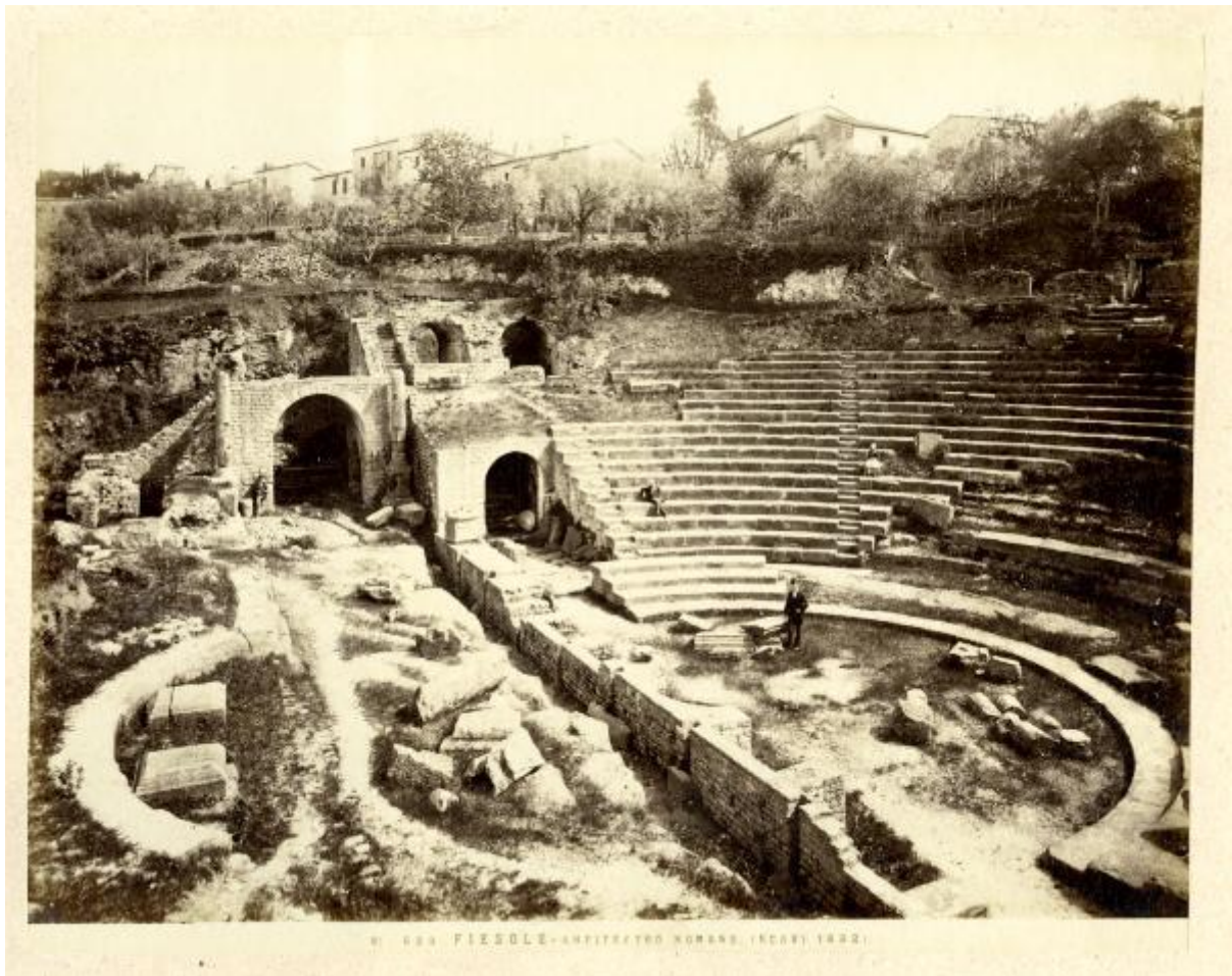
11. PIESOLE - AMPITHEATRO ROMANO. (SCOP. 1882.)