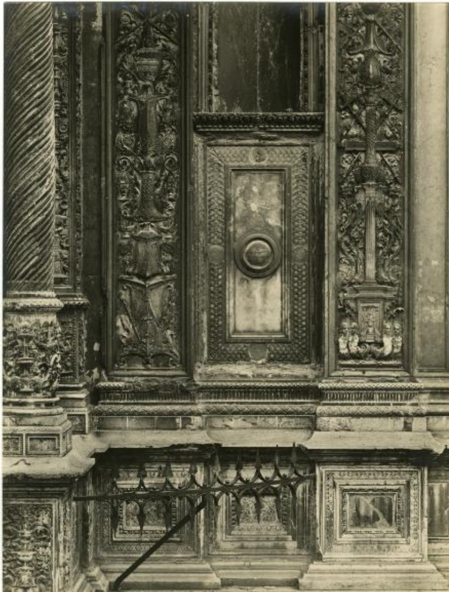
P. I. N.° 14067, BRESCIA - Chiesa di S. Maria dei Miracoli. Dettaglio della parte inferiore della Facciata. (XV al XVII Secolo.)