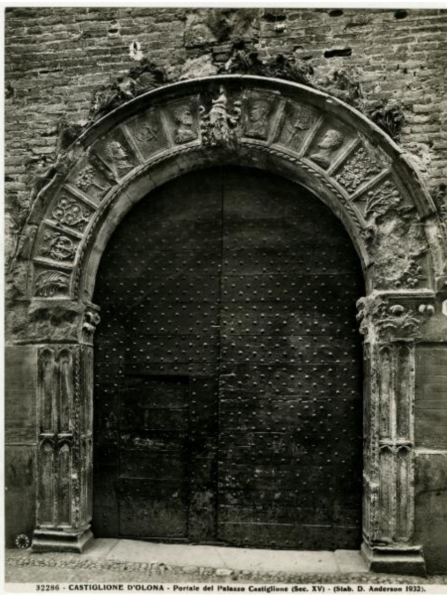
32286 - CASTIGLIONE D'OLONA - Portale del Palazzo Castiglione (Sec. XV) - (Stab. D. Anderson 1932).