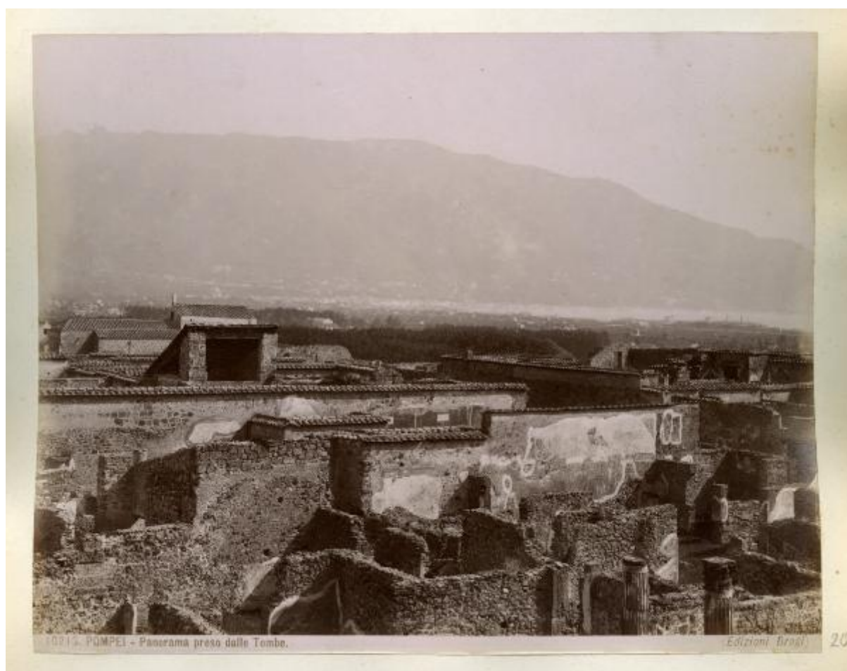
10715. POMPEI - Panorama preso dalle Tombe.