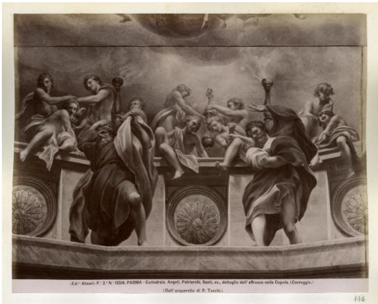
P. 2. N. 15516. PARMA - Cattedrale. Angeli, Patriarchi, Santi, ecc., dettaglio dell'affresco nella Cupola. (Correggio.)