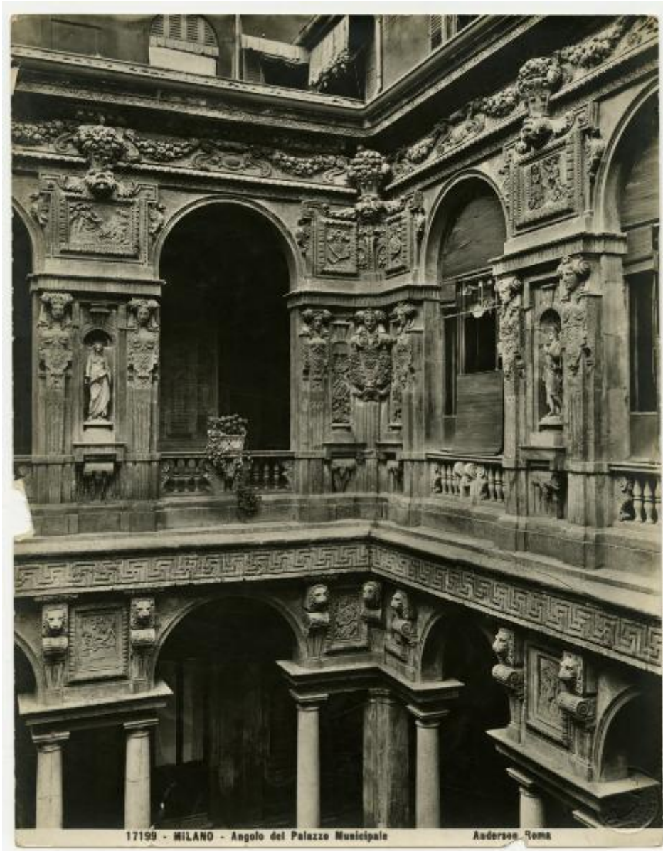
17199 - MILANO - Angolo del Palazzo Municipale