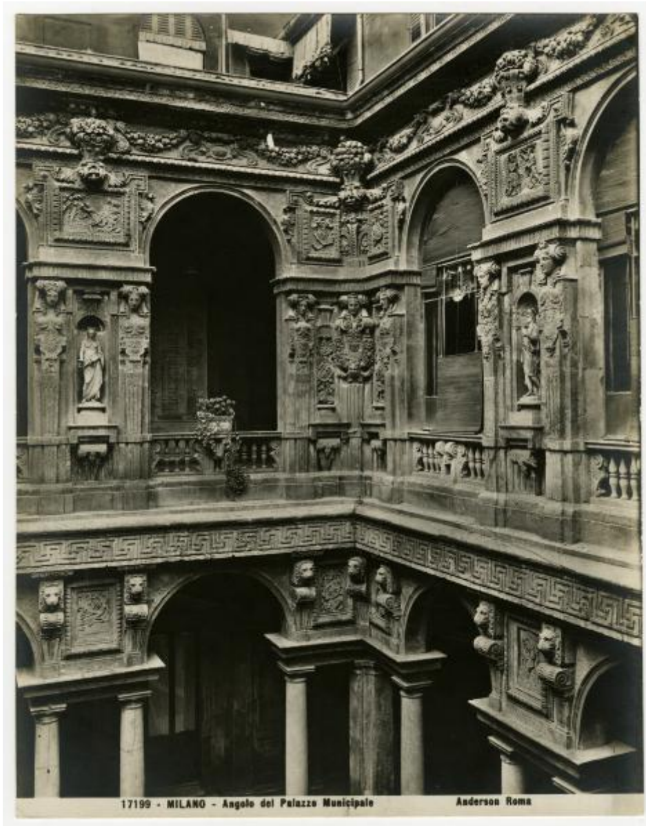
17199 - MILANO - Angolo del Palazzo Municipale