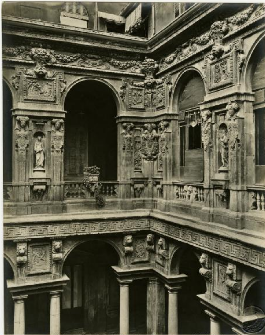
17199 - MILANO - Angolo del Palazzo Municipale