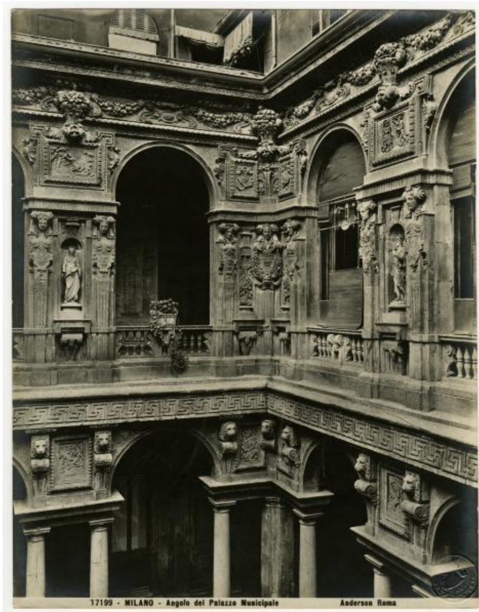
17199 - MILANO - Angolo del Palazzo Municipale