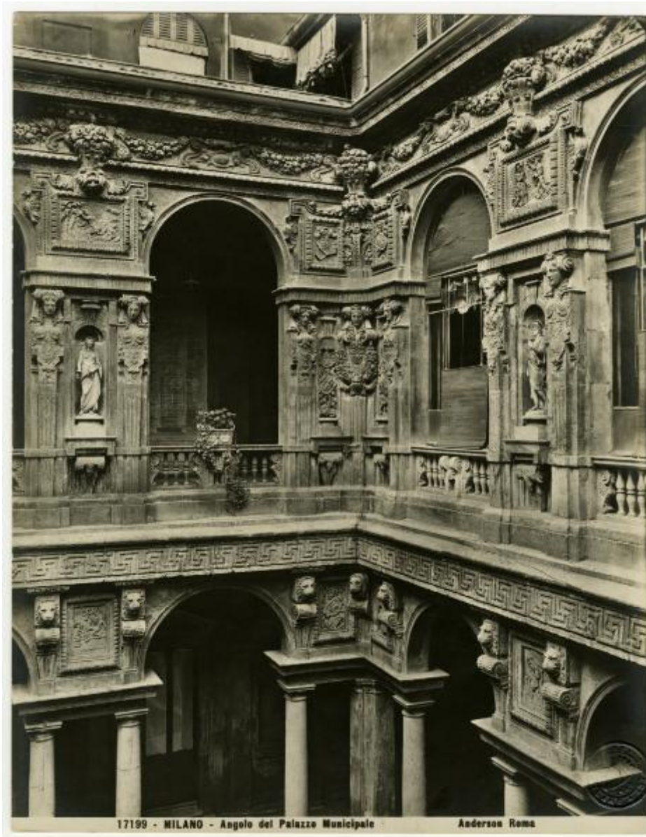
17199 - MILANO - Angolo del Palazzo Municipale