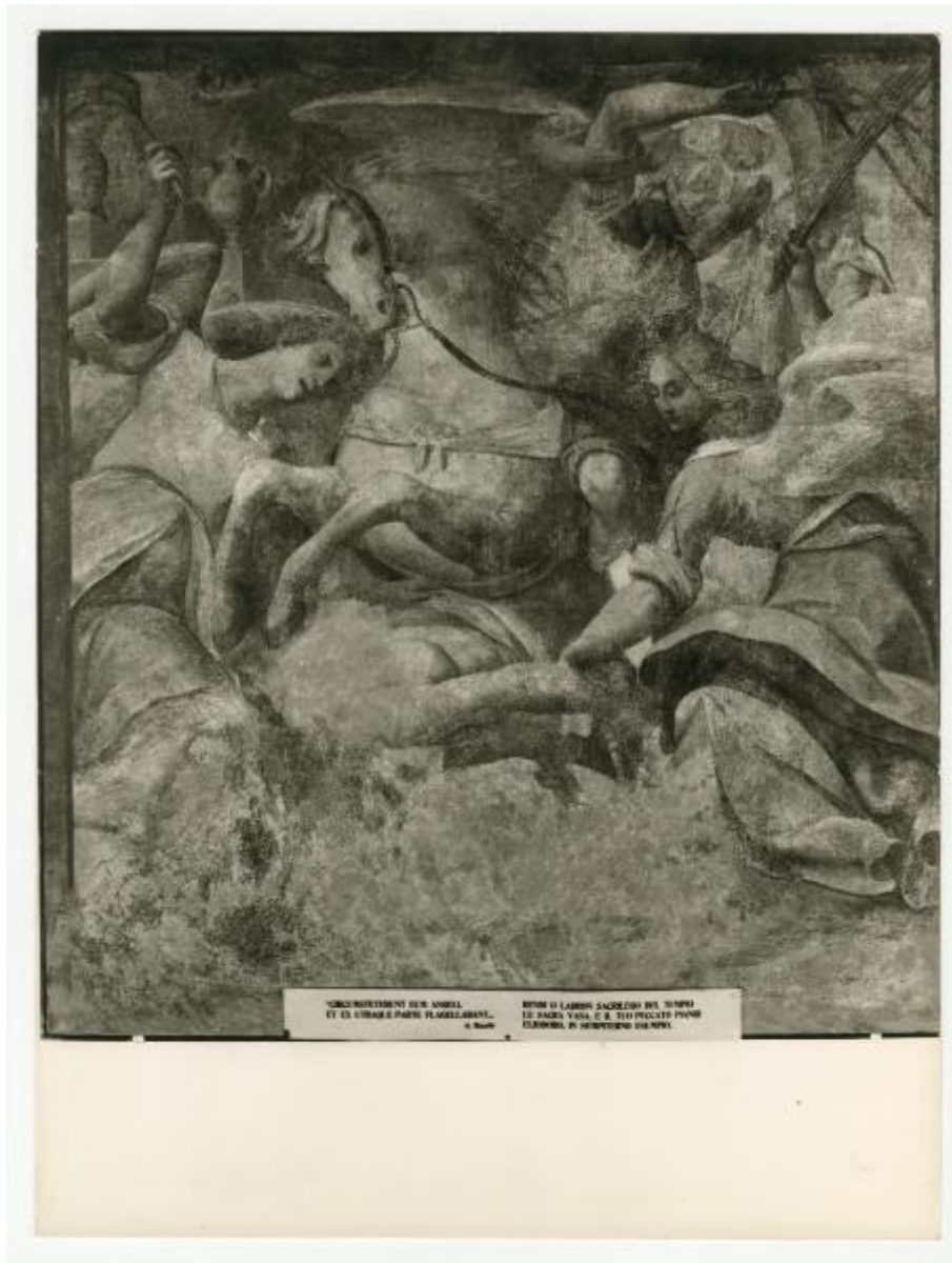
SCENEFESTIVO DEI ANGELI ET EX STRANA PARTE FLAGELLANT. di Michel RITRO IL LABIRIN SACERDOTE DEL TEMPIO LE SACRE VASA E IL TRO POCO TO PRIMO ELABORAZIONE DI SCULTURA DI ROMA.