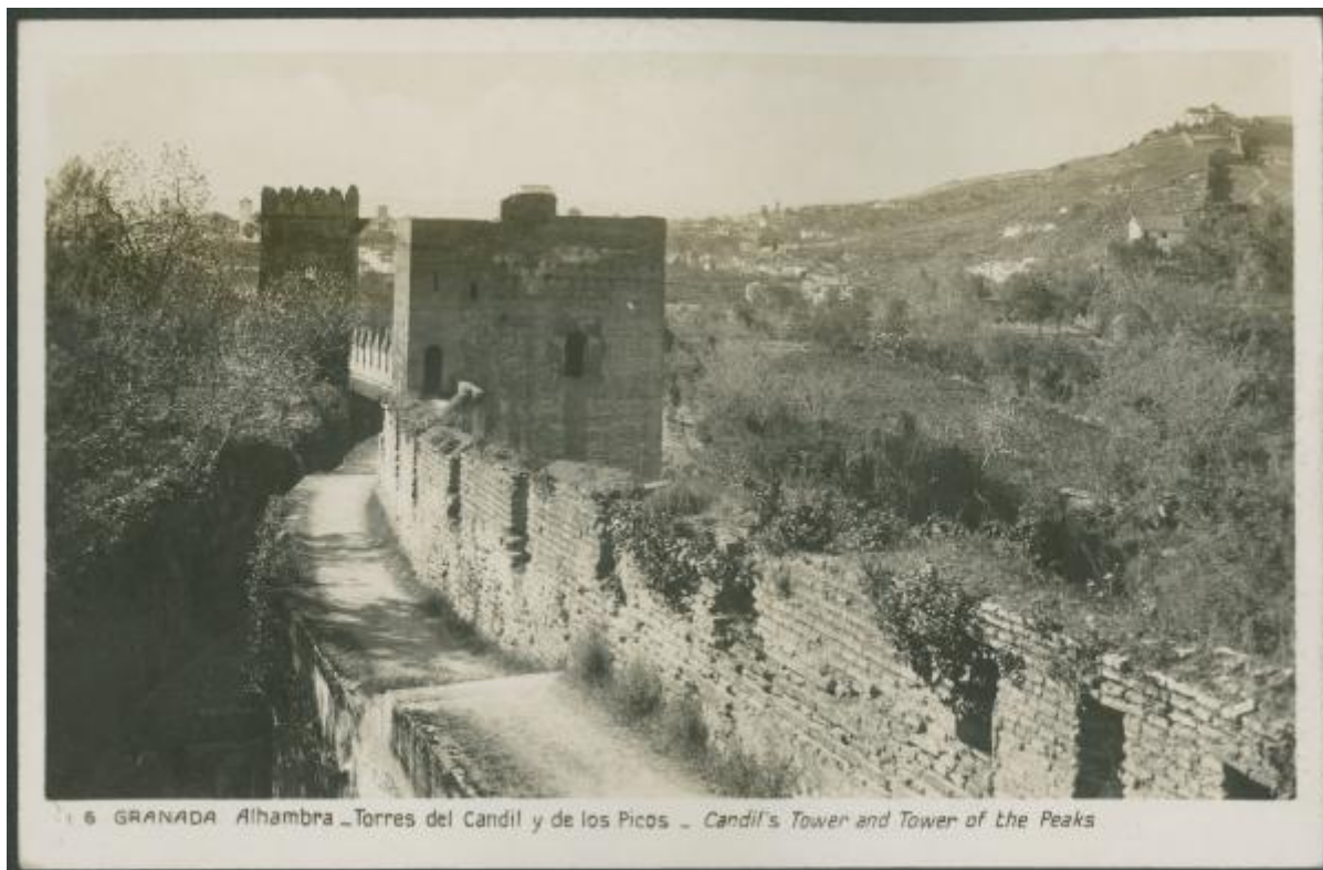
6 GRANADA Alhambra - Torres del Candil y de los Picos - Candil's Tower and Tower of the Peaks

Link risorsa: https://www.lombardiabeniculturali.it/fotografie/schede/IMM-3a340-0000719/