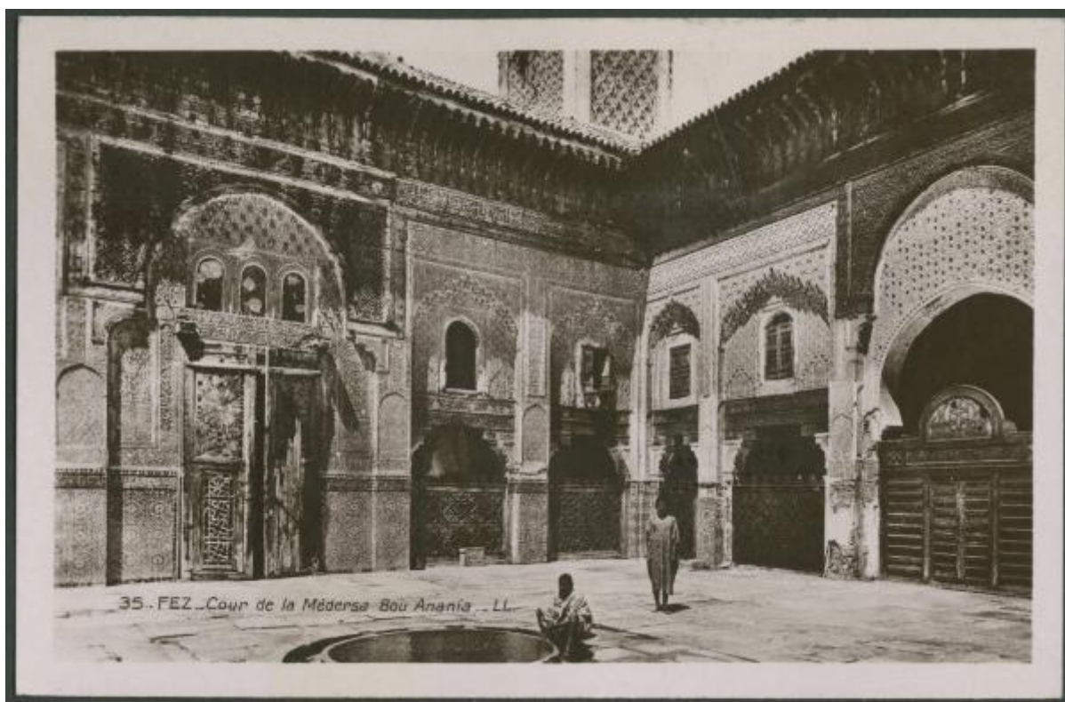
35 - FEZ - Cour de la Médersa Bou Anania - LL