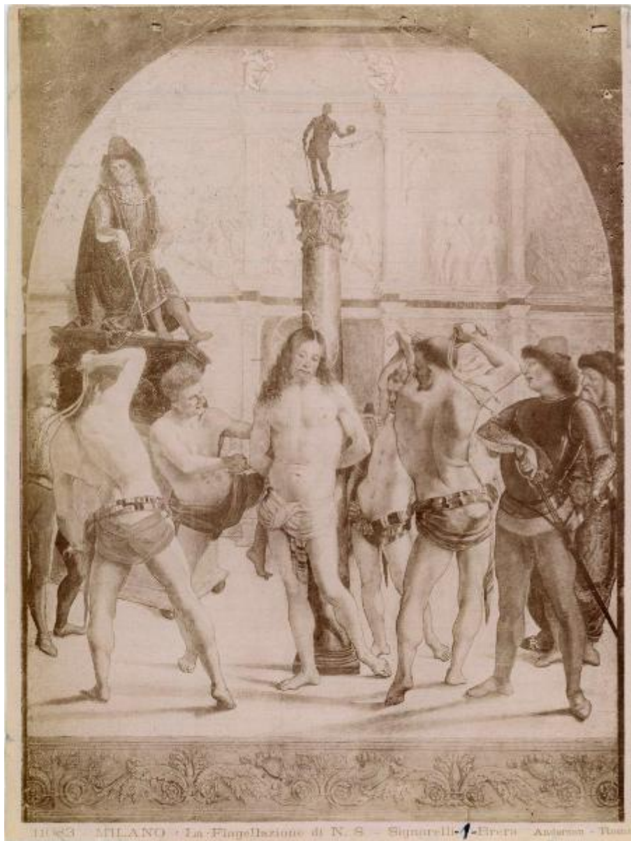
1183 MILANO - La Flagellazione di N. S. - Signorelli - Firenze - Andrea - Roma