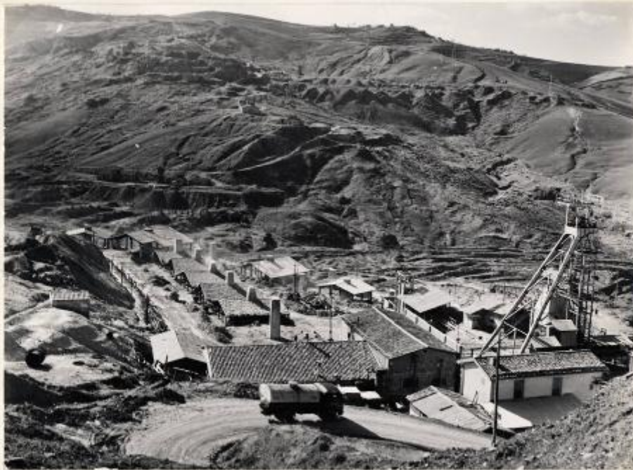
Foto n. 9465 - Veduta generale della miniera

Ufficio fotografico Montecatini / Montecatini Edison / Montedison