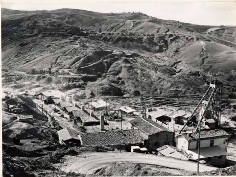
Foto n. 9466 - Veduta generale della miniera