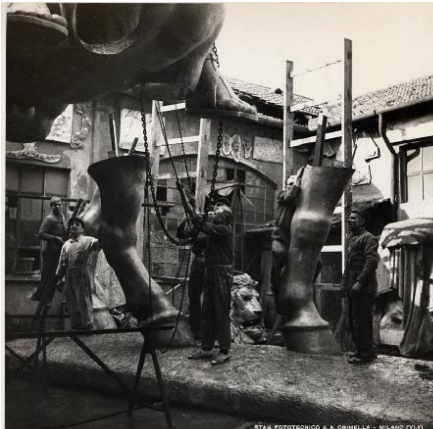
STAB. FOTOTECNICO S. A. CRIMELLA - MILANO (VI-5)