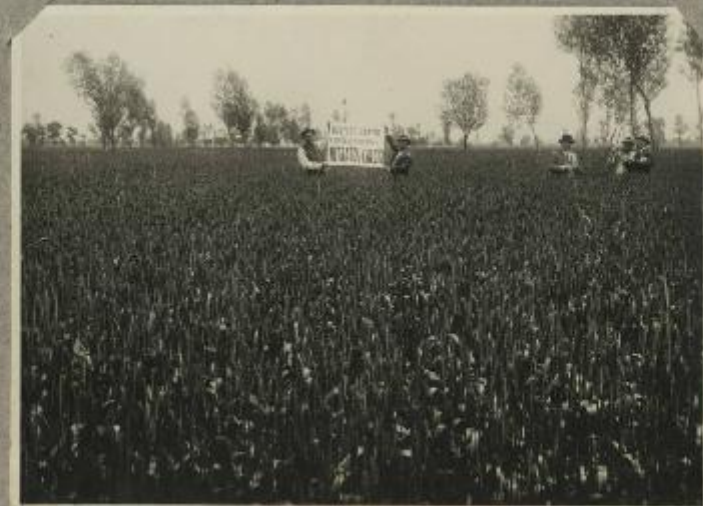
Frumento e 97. Cadute