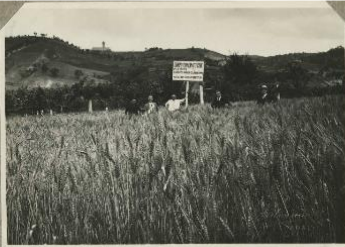
96. Frumento e Piedalpi