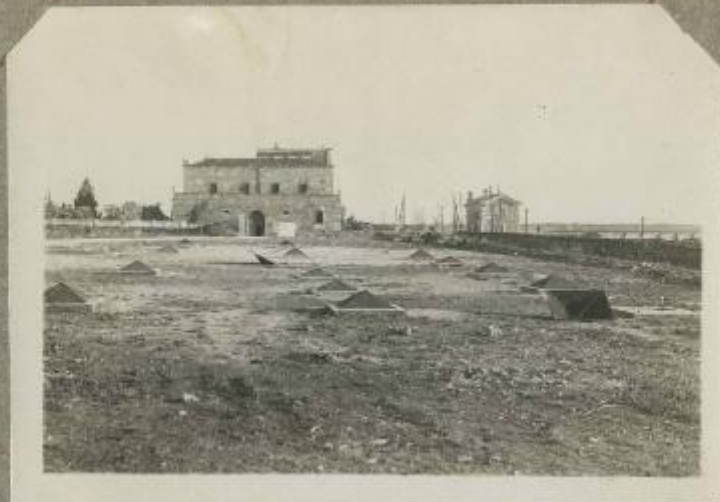
Le caserme sotterranee