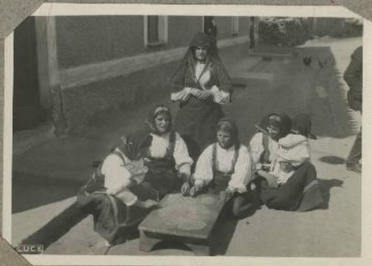
Donne serbe intente alla cura del pane