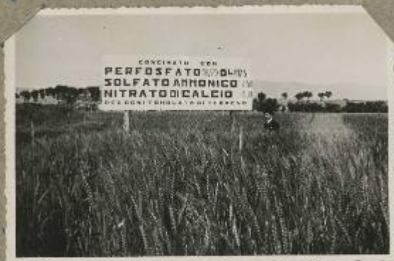
102 Colabuci 1975.