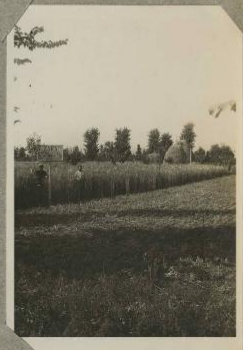
104 Podere modello di Base