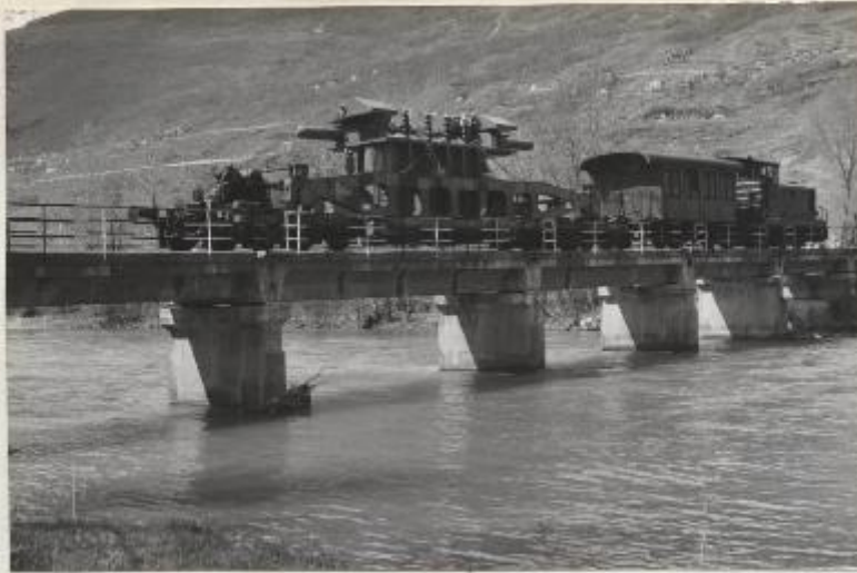
Sul ponte dell'Adda a Piateda