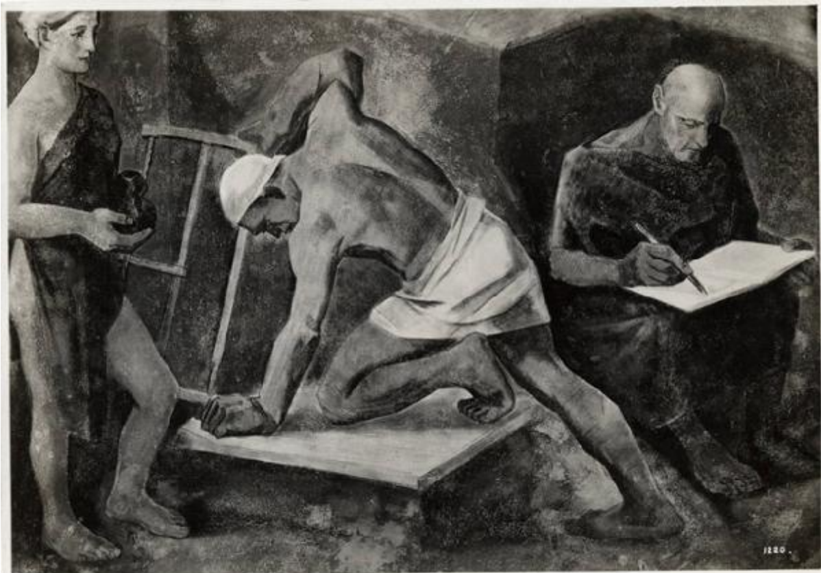
V TRIENNALE DI MILANO 1883 FRANCO FOTODUOMO S. A. CREVELLA SIEF