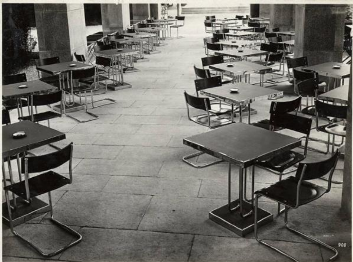
V TRIENNALE DI MILANO 1955 BRUNO ZEVI S.p.A. GIOIELLA 3117